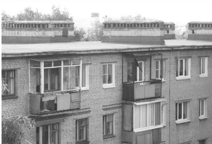
Рис. 1. Плоская крыша без защитного ограждения дома

и СП 118.13330. При проектировании кровель следует предусматривать различные специальные элементы для обеспечения безопасности. К ним могут быть отнесены крюки для навешивания лестниц, анкеры для крепления страховочных тросов, стационарные лестницы и т. п. В данном нормативном документе приведены только общие требования безопасности.